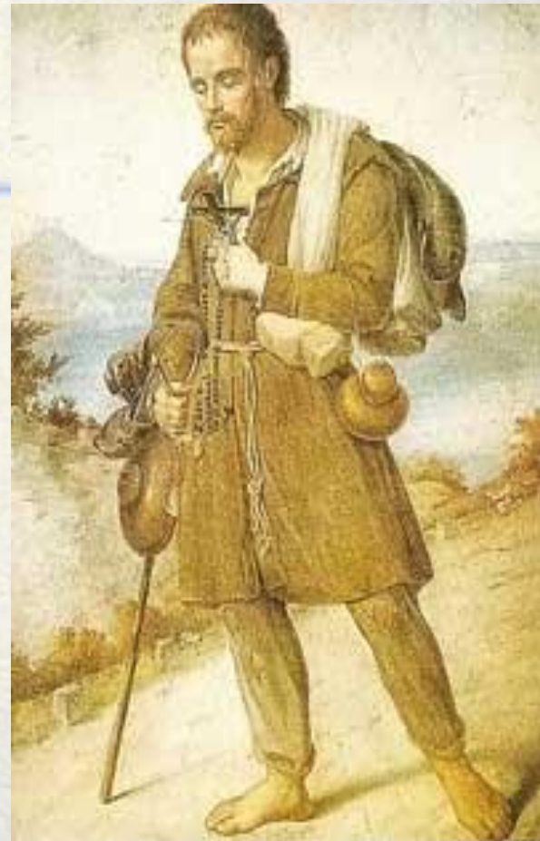
SAINT BENOIT-JOSEPH LABRE